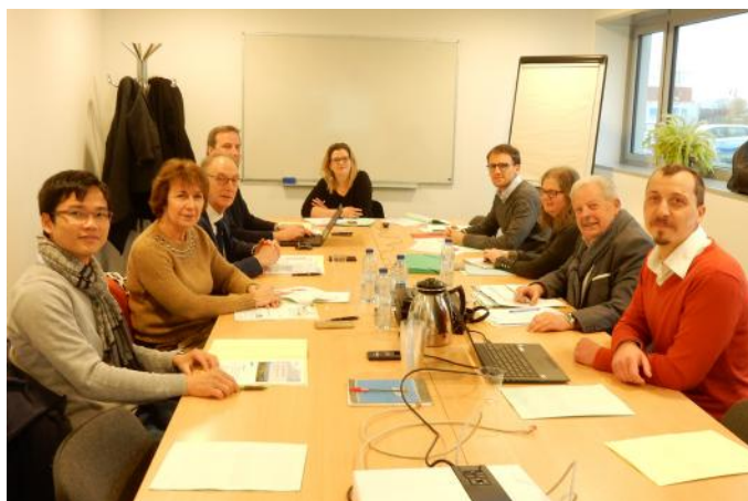
Comité territorial de la Somme - 7 décembre 2017

Pour faciliter la participation de ses membres, les comités territoriaux privilégient des lieux de réunion différents sur le territoire.