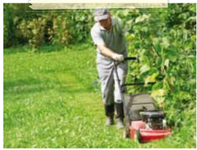
La tonte haute