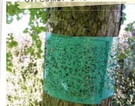
Un collier anti-fourmis

* Mettre en place des barrières ou pièges contre les animaux parasites. Par exemple : pièges mécaniques à taupe ou à limace, voiles anti-insecte, filets de protection contre les oiseaux ou sur les cultures du potager, colliers empêchant les fourmis de remonter le long des troncs.