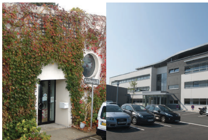
Les deux sites d'Atmo Picardie à gauche à Amiens, à droite à Boves

Les techniques d'analyses sont automatiques avec fourniture des données en temps réel ou en différé (prélèvements d'échantillons et analyses en laboratoire).